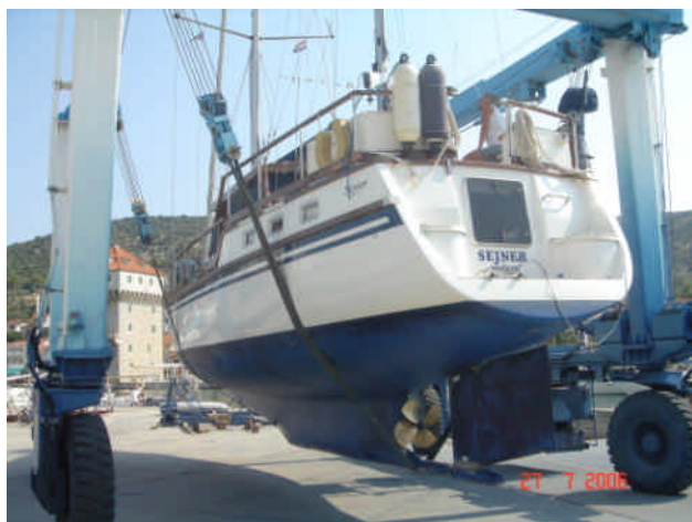
Sejner på vej i vandet