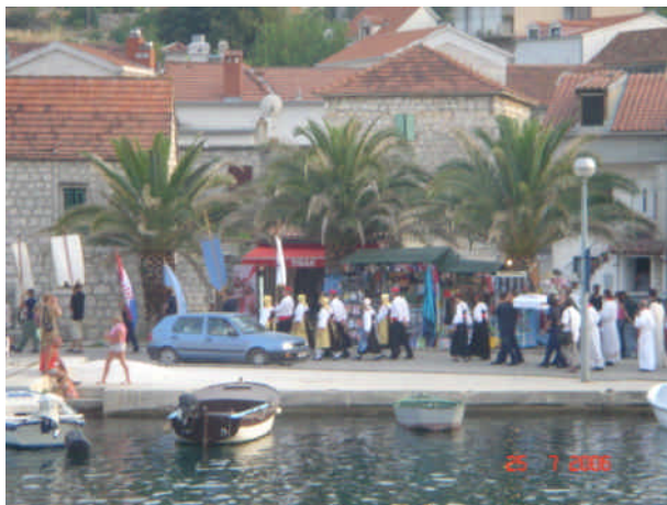
Optog gennem Marina by