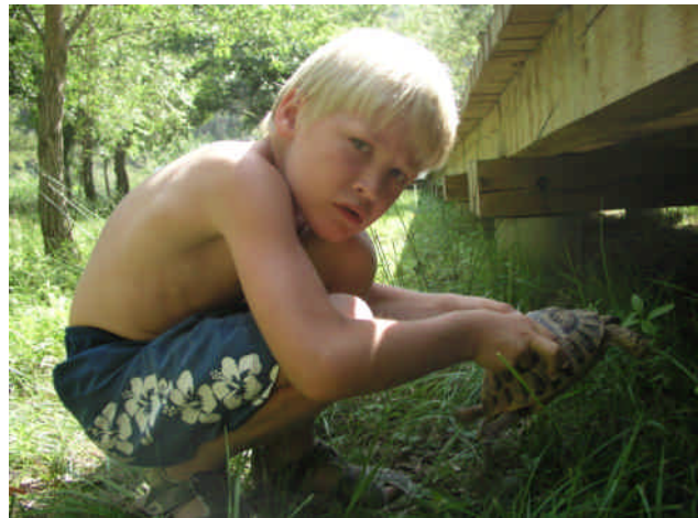
Det er skildpadden til venstre.....