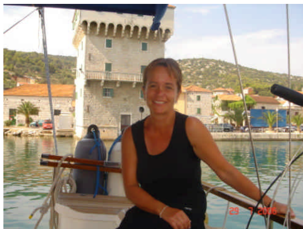
Er Ann ikke blevet dejlig brun?