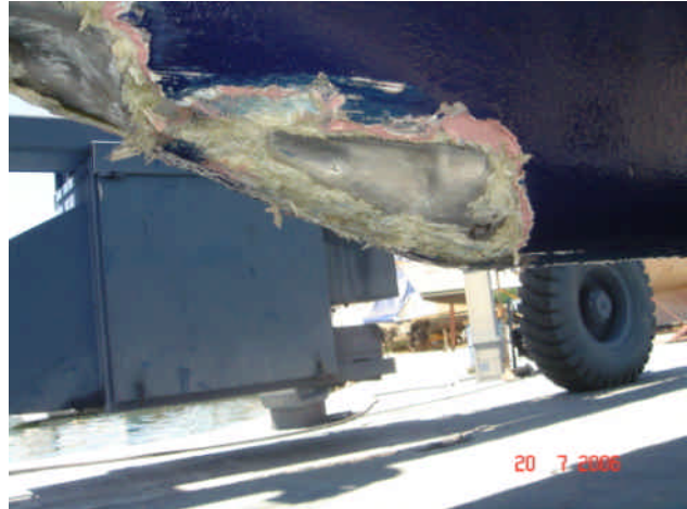
Buler på kølen