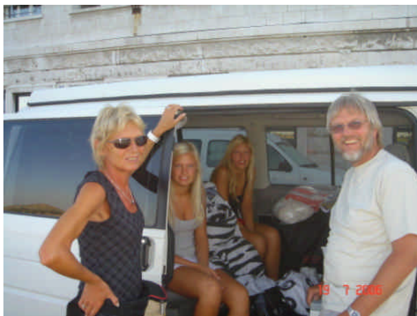
Afgang til DK