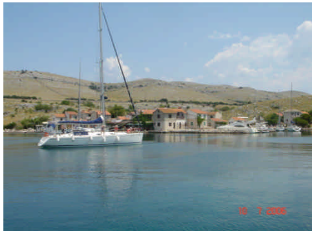
Frokost ved Vrulje