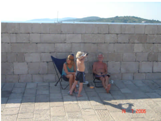
Et skyggefuldt sted på havnen i Vodice