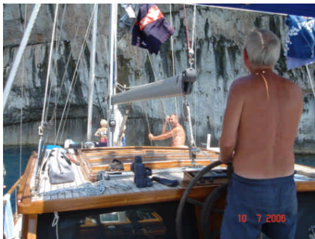
Klipperne på Mana