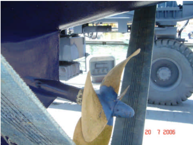
Et bøjet propelblad