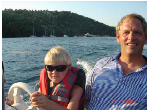
Hvem er ham gutten med solbrillerne?