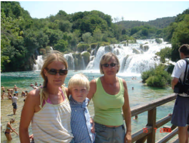
Bare vi kunne sætte lyd på