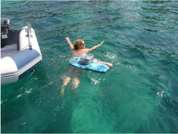
Røget flæsk på surfbræt