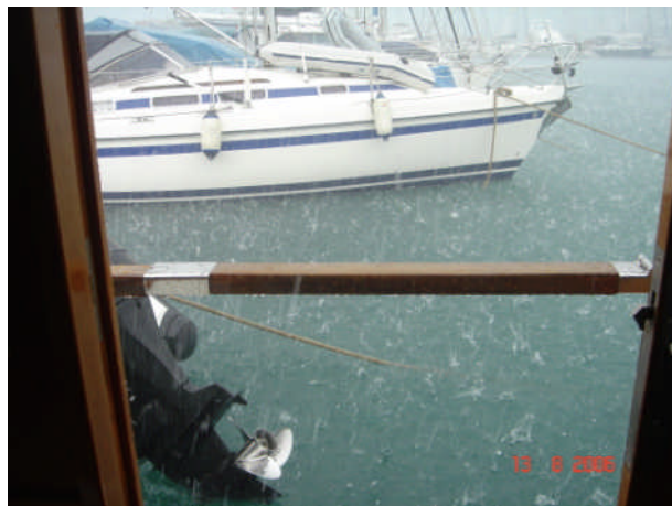
Søndagens regn/haglvejr i Marina