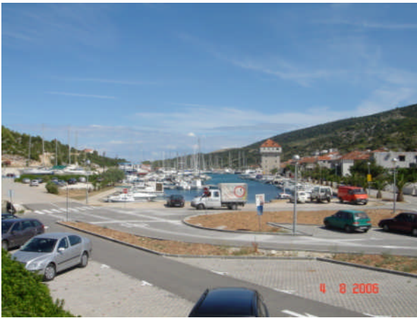
Udsigt over marinaen i Marina!!!!