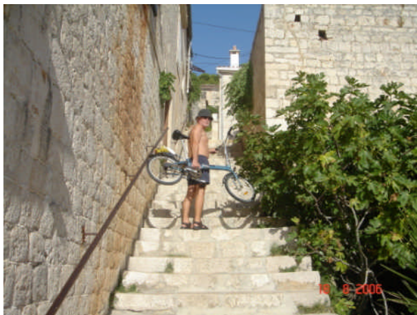
Vi tager lige en genvej!!