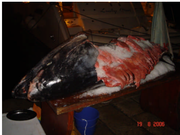
Så er der tunbøffer....